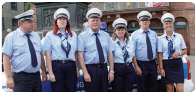
Sicherheitsgewerbe kann Polizei unterstützen